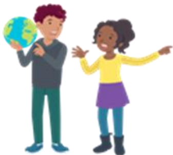
We lossen conflicten zelf op

Hoort u van uw kind over 'opstekers' en 'afbrekers'? Vraag er naar en praat er over. Laat uw kind weten wanneer hij of zij een 'afbreker' aan iemand geeft. Stimuleer om 'opstekers' te geven. Doet u dat zelf ook naar uw kind en noem daarbij dan de term 'opsteeker'. Voor de ouders van kinderen uit groep 1 tot en met 6: bespreek de kletskaart van blok 2 met uw kind. U vindt deze op onze website .